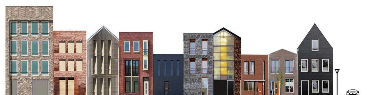
VOORBEELD STRAATBEELD OUDE HAAGWEG