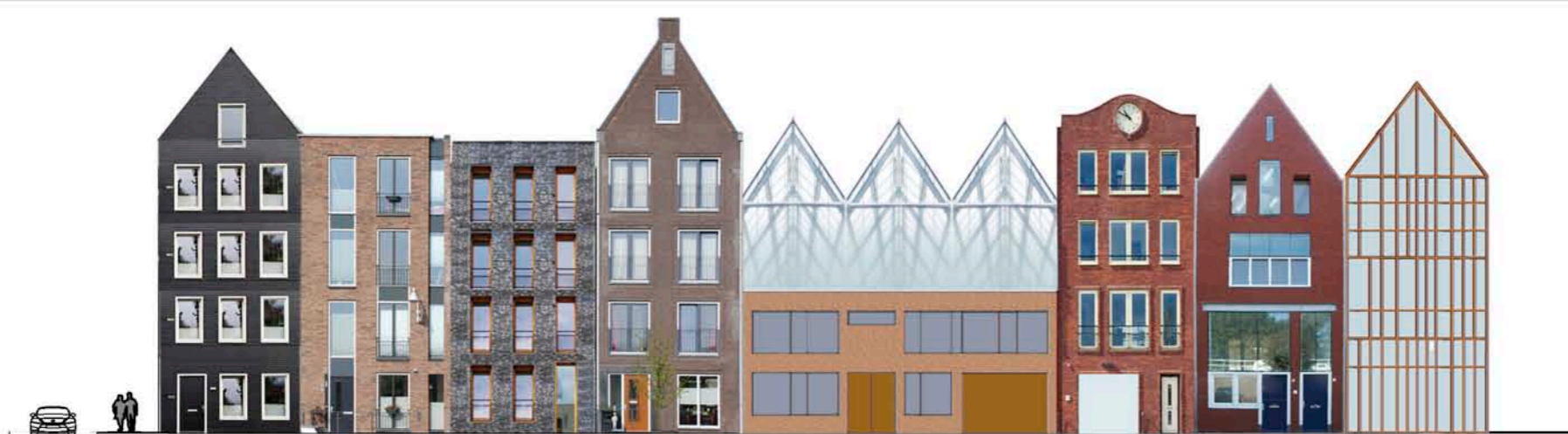
ZIJSTRAAT MET RAW SPACES